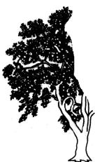
Schnitt aus Juden