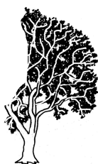
Schnitt aus Heiden